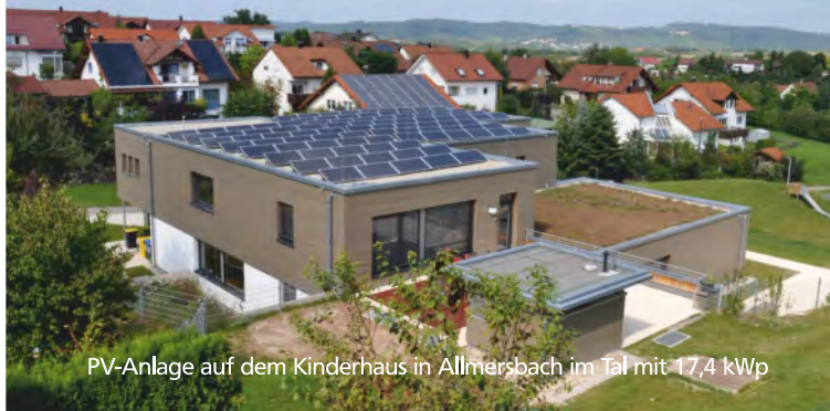
PV-Anlage auf dem Kinderhaus in Allmersbach im Tal mit 17,4 kWp

„Ihr persönlicher Beitrag zum Klimaschutz: Wechseln Sie jetzt in fünf Minuten zum Öko- Bürger- strom!“